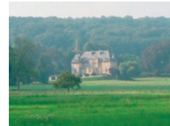
Le château de Cuts

Face à la mairie, prenez la petite ruelle sur votre gauche. Arrivés devant l'entrée principale du château, continuez tout droit "rue des Ormeaux". Prenez ensuite à droite la "rue du Jonquoy le Bas" puis en bas continuez tout droit sur le chemin qui longe le parc du château.