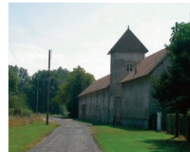
La ferme «de la vallée»

4 Au croisement avec la route, vous avez la possibilité d'emprunter le raccourci (3 km en moins). Prenez alors à droite sur la route et ensuite à droite pour entrer dans les bois puis à gauche pour ensuite suivre le balisage GRP (jaune et rouge) dans la descente. Prenez à gauche sur la route, puis tout de suite à droite pour entrer dans les bois et à gauche à la patte d'oie. Au carrefour suivant, continuez tout droit le long du champ et au deuxième carrefour situé au coin d'un champ, prenez à droite le chemin qui descend. Continuez toujours tout droit sur le même chemin. Vous aurez la possibilité de prendre à gauche (environ 500 m plus loin) la liaison vers le circuit de St Lucien.