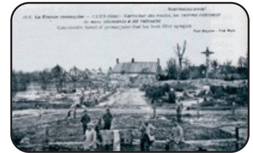
Le calvaire de la Pommeraye après les combats de 14-18

Le Calvaire était considéré par les Allemands comme miraculeux (certaines cartes postales ont pour légende " le miracle de Cuts ") car toutes les maisons des alentours ont été détruites alors que le calvaire est resté indemne.