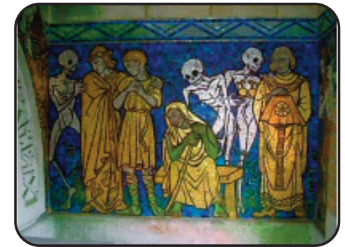
La danse macabre : la mort avec le tyran, la vieillesse et le prêtre

A ce jour, 2 danses macabres du 20e sont connues en France. Celle de Guiscard a été classée parmi les plus grands monuments historiques de Picardie.