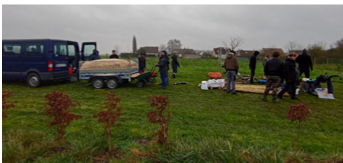
Accompagnement technique assuré par le lycée horticole de Ribécourt

Si ce dispositif vous intéresse, retrouvez plus d'informations sur le site : www.sourcesetvallees.fr/rubrique-Espace-test-de-Sources-et-Vallees