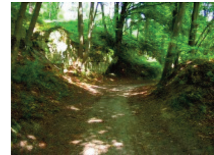
Départ de Béhéricourt

devant l'église de Salency, à 4 km à l'est de Noyon sur la N 32. Face au château de Béhéricourt, à l'est de Salency