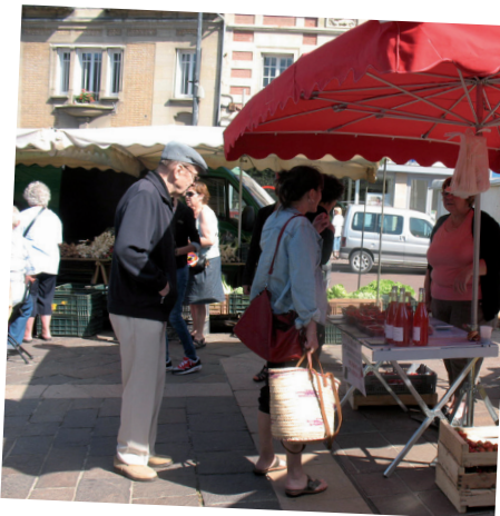
25 juin : les initiatives régionales de l'environnement pour apprendre les éco-gestes et profiter du marché de produits locaux