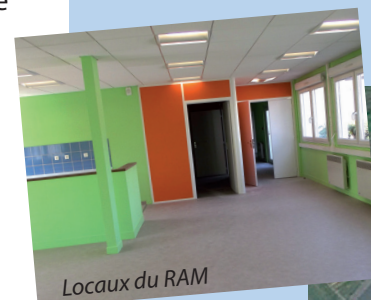
Locaux du RAM

----- Rens : Émilie PICOT-CANDELE Éducatrice de jeunes enfants Animatrice du Relais Assistantes Maternelles en Pays Noyonnais 03 64 47 30 18 / ram@paysnoyonnais.fr