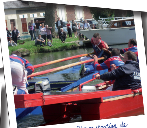
31 mai et 1er juin : Démonstration de joutes à Pont-l'Évêque lors de l'Oise verte et bleue, par l'U.S de Longueil-Annel. Nombreuses animations nature, canoë, pèche, randos pour tous !