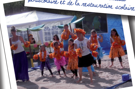
18 juin : spectacle des enfants du secteur de Noyon (ici, site de l'école Yolande Brioy)