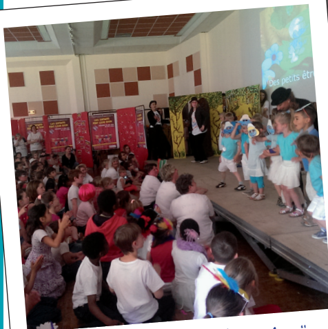
18 juin : "les enfants font leur show" spectacle des enfants du secteur sud-est du Pays Noyonnais. 180 enfants et environ 200 parents étaient présents