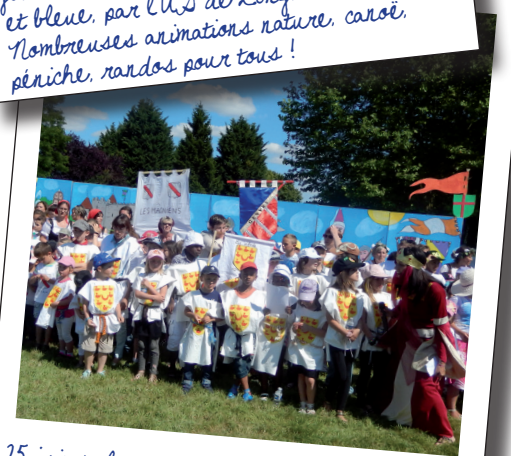
25 juin : olympiades traditionnelles picardes (secteur nord-ouest du Pays Noyonnais) avec plus de 180 enfants des accueils périscolaire et de la restauration scolaire