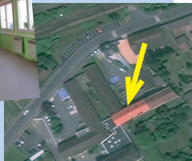
Localisation du RAM, rue du Moulin St Blaise