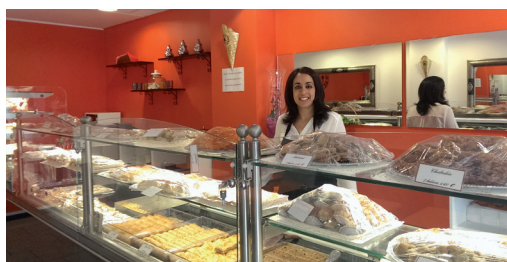
«Aux Délices de l'Orient» - 27, place de l'hôtel de Ville à Noyon 03 60 19 07 32 - Ouvert du mardi au dimanche inclus de 9h à 12h30 et de 13h30 à 19h30

Elle a bénéficié de l'accompagnement à la création d'entreprise de la CCPN pendant 7 mois (étude de marché, travail sur le concept, réalisation du prévisionnel...) et a obtenu deux prêts à