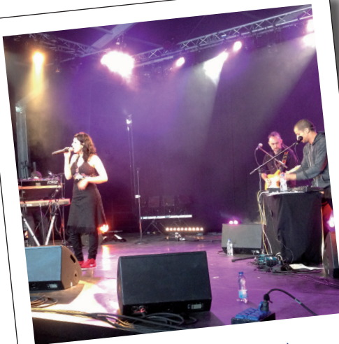
10 + 11 mai, L'Oise en quinquette à Pont-l'Évêque : théâtre de rue, cirque, concerts... De belles émotions !

Autant de rendez-vous qui permettent de renforcer les échanges et le lien social sur le territoire.