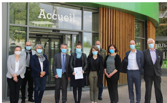
Signataires du Contrat Local de santé, le 21 mai.