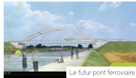
Le futur pont ferroviaire

verre et de styrène) et conteneurs. Deux ouvrages d'art accompagneront la future plate-forme : une écluse d'une élévation de 20 mètres derrière le quartier Beauséjour à Noyon et un pont ferroviaire d'une portée de 172 mètres sur la commune de Pont-l'Évêque.