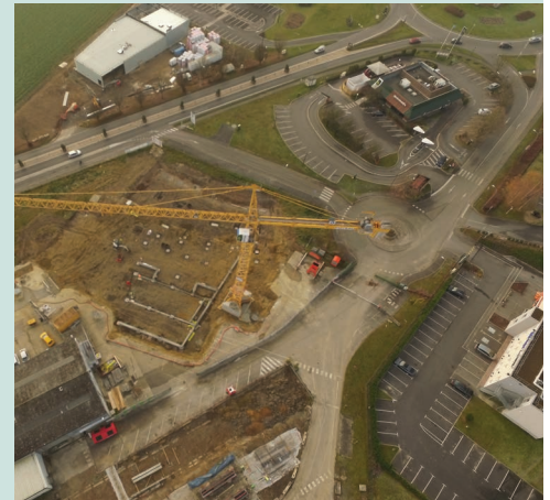
Vue aérienne des deux chantiers : le bowling, adossé au Comptoir du Malt et le cinéma, à proximité du restaurant Mc Donald.

• Enfin, le projet de pôle aquatique qui est finalisé reste dans l'attente de l'accord des co-financeurs institutionnels (Région Hauts-de-France et Centre national pour le développement du sport).