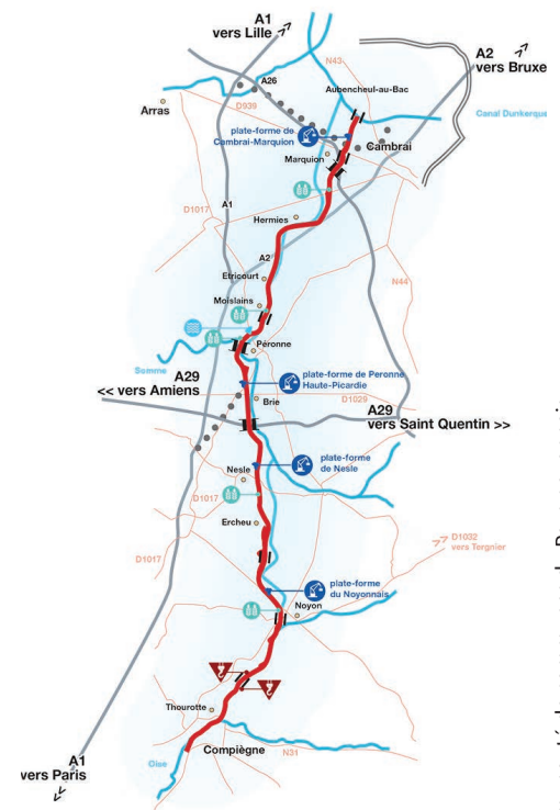
Le futur tracé du canal Seine-nord Europe, entre Compiègne et Aubecheul-au-Bac. L'une des quatre plate-formes du projet sera implantée à Noyon.

Le Noyonnais accueille ce projet titanesque qui constituera un levier de croissance et d'emploi, source de développement durable des territoires.